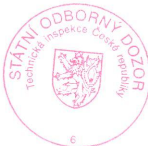
Ing. Roman Řezáč vedoucí inspektor pobočky

Toto osvědčení nahrazuje osvědčení ev. č. 6338/6/10/R-PZ-f,g